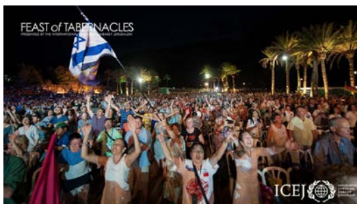
פסטיבל הסוכות השנתי של "השגרירות הנוצרית", 2014.

למרות טענותיו של המטיף בדבר חטאיו הכבדים של העם היהודי, מוסדותיה הרשמיים של אותה "אומה שצריכה להינצל" פרשו חסות ממלכתית על האירוע הדתי. למעשה, משתכפי הכנס אף זכו לברכה מצולמת מראש הממשלה, בנימין נתניהו, שהצהיר כי "אין לישראל חברים טובים מכם בשום מקום בעולם". 4 בולר לא חסך במחמאות אף הוא. "אין ממשלה בעולם המנהלת קשרים הדוקים כל-כך עם אוונגליסטים כמו ממשלת ישראל", אמר לקהל. 5 ואכן, אכילו נשיא המדינה, ראובן ריבלין, פינה זמן בלו"ז העמוס של "הסוכה הנשיאותית הנוודת" כדי להגיע להשתתף באירוע באופן אישי. 6 הייתה זו הפעם הראשונה בתולדות המדינה שהנשיא עצמו מגיע לנאום בטקס הסוכות השנתי של הנוצרים האונגליסטים. 7 למרות זאת, בחרו בבית הנשיא להצניע את האירוע.