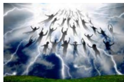
רגע ה"קריעה" כפי שהוא מתואר ביצירת אמנות אוונגליסטית

השקפה זו מבוססת על פרשנות ליטרלית של חזון יוחנן, הספר האחרון בברית החדשה. על-פי פרשנות זו, זמן קצר לפני ההתגלות יעלו השמיים כל הנוצרים "האמיתיים" ולצדם "שארית ישראל" - יהודים שיקבלו על עצמם את האמונה בישו. הנס הזה, המתואר ביצירות אמנות אוונגליסטיות כריחוף המוני של רבבות בני-אדם אל עבר העננים, יציל את המאמינים מתקופה של שבע שנים שבה