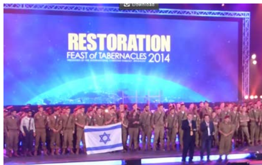
חיילי צה"ל בפסטיבל הסוכות של "השגרירות הנוצרית" בירושלים, 2014