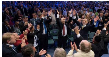
השר עוזי לנדאו וח"כ גילה גמליאל בכנס של ה-IAF בהונגריה, יוני 2014