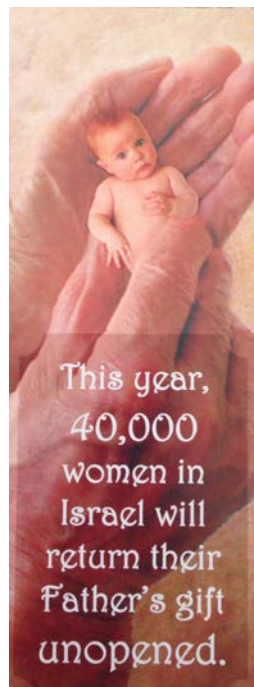
סימנייה של עמותת "בעד חיים" שחולקה בפסטיבל סוכות הנוצרי 2014-ב

מנכ"לית עמותת "בעד חיים": "אפשר רק להציל תינוקות, לתת לאם בגדים וחיתולים ולומר לה 'לכי לשלום', אבל אני רוצה להציע הרבה יותר לאמהות שלנו... לאנשים יש זכות לדעת שאלוהים מיעד לישראל מערכת יחסים איתו ועם המשיח"