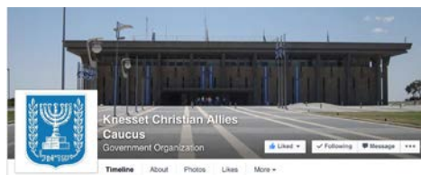
עמוד הפייסבוק של השדולה

אנשי הקרן מכרים באופן עקבי סעיף נוסף בתקנון הכנסת, שקובע כי אסור לשדולה או לאדם הפועל מטעמה שאינו חבר כנסת לעשות שימוש בסמל הכנסת או בסמל המדינה 144 . למרות זאת, בלוגו של השדולה האוונגליסטית משולב סמל המדינה 145 . בנוסף, בדצמבר 2014 חתמו פעילי הקרן על ברכת חג המולד ששלחו בסמל רשמי שהשימוש בו מוגבל למוסדות ממלכתיים בלבד 146 . ל"מולד" נודע כי ריינשטיין אף נהג לחלק כרטיסי ביקור עם סמל הכנסת, בניגוד גמור לתקנון. מצג שווא זה עלול ליצור את הרושם המוטעה שעובדי הקרן מועסקים על-ידי הכנסת או שהארגון שלהם הוקם עקב החלטת ממשלה - דבר שלא התרחש מעולם.