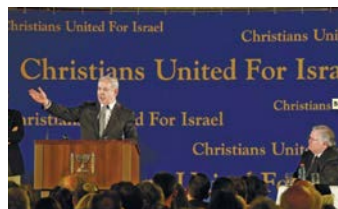
מרץ, 2012. נתניהו נואם בכנס של "נוצרים מאוחדים לישראל" שהתקיים בירושלים. מימין: ג'ון הייגי, שעומד בראש הארגון

נוסף על כך, בספרו "מיהו יהודי?" טען המטיף כי "היטלר הוא חצי יהודי, מצאציו של עשו" וכי "השואה התרחשה מפני שהיהודים מרדו והתכחשו לאלוהים האמיתי". לדבריו, "המרדנות של היהודים היא הסיבה לאנטישמיות ולרדיפות מהם סבלו במשך השנים". את היהודים הרפורמים כינה "מורעלים" ו"עיוורים מבחינה רוחנית" 73 .